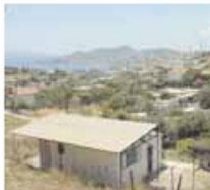
Εξώφυλλο: Λαυρεωτική 2005